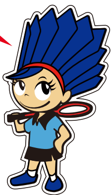
チームマスコット「ミントちゃん」